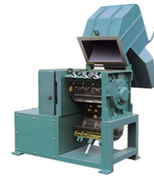
機 械 名 / Z-420 モーター / 4P 7.5kW 機械寸法 / 1,200mm (W) 1,080mm (L) 1,500mm (H) 機械重量 / 630kg

回転刃の直径と総幅を最大限に活用した大口径を持ち、優れた喰込み性を発揮してビッグボリュームの成形品を一気に粉砕します。厚板・シートを固定刃に乗り上げることなくスムーズな処理ができます。スクリーンの開閉だけで、刃物の取替、調整、スクリーン交換が簡易にでき、内部の掃除もスピーディに行えます。 被粉砕物の室内分散を効率よく行う「エースカッター」は、独特のオープンカッターのため、発熱が小さく低融点材料やホットな材料の粉砕に有効です。小さな回転刃でも大きな喰込み性能を発揮するため、小動力で高效率。発熱による動力ロスも少なく、省電力効果は抜群です。回転刃にボルトセット式のブレードを採用し、取替が簡単にできます。しかも刃の研削を繰り返しても回転刃外径をベストに保持出来るため、粉砕条件が一定で、常に安定した高性能を発揮します。