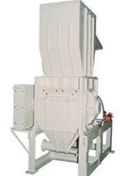
機 械 名 / ZA-50702 モーター / 4P 37~75kW 機械寸法 / 1,500mm (W) 2,230mm (L) 2,850mm (H) 機械重量 / 3,400kg