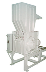
機 械 名 / ZA-562 モーター / 4P 22kW 機械寸法 / 1,347mm (W) 1,990mm (L) 2,720mm (H) 機械重量 / 2,900kg